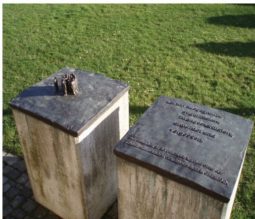
Mahnmal vor der Tagesklinik

„Willst Du etwas wissen, so frage einen Erfahrenen und keinen Gelehrten.“